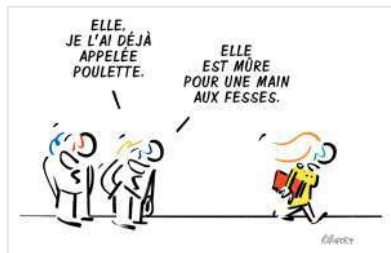
Dessin de Gilles RAPAPORT http://dessins-rapaport.com

L'article L.1142-2 1 introduit la notion d'agissement sexiste dans le code du travail « Nul ne doit subir d'agissement sexiste, défini comme tout agissement lié au sexe d'une personne, ayant pour objet ou pour effet de porter atteinte à sa dignité ou de créer un environnement intimidant, hostile, dégradant, humiliant ou offensant ».